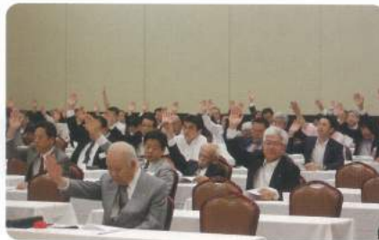
賛成多数と認めます!