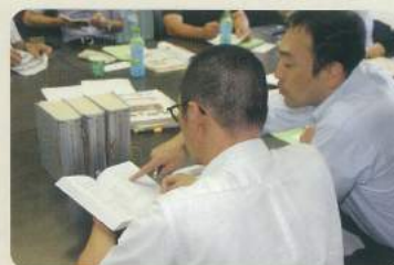
定款をチェック中……

定款や諸規則の制定や改廃に関することも、総務委員会の重要な役割です。必要に応じて条文などの見直しを行いますが、複雑な条文や規約等の体系のなかで整合性が保たれるように、規則集とにらめっこしながら重箱の隅をつつくような議論を重ねます。やっぱり地味……。