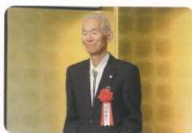
50年表彰 石税協のレジェンド