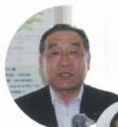
いかつい顔ですが私が本部長です。