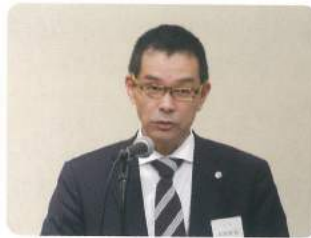
流暢な語り口の北村専務

通常総会終了後、新役員による理事会が開催され、理事長・副理事長・専務理事が互選により選任された。理事長には雲野照正、副理事長に川上一夫、高柳満、小栗巖、茶谷義隆、専務理事に野村和宏が選出された。