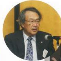
ご意見ございませんか?