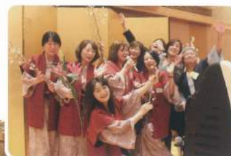
保険業界の 宝ジェンヌよ ❤️