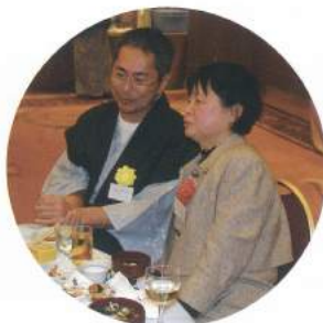
ふーん… 次の料理まだかなあ