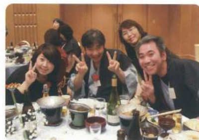
4月から保険料 あがるげんて