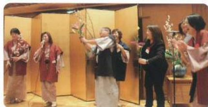
えっ、花瓶の生け花まで 小道具に!!