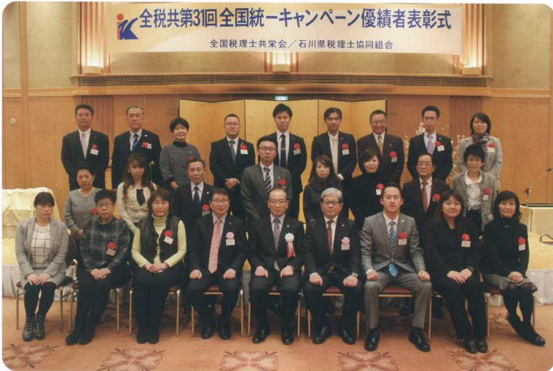
受賞者のみなさん、おめでとうございます。

2月3日15時から和倉温泉「のと楽」において、全税共第31回全国統一キャンペーン優績者表彰式が開催された。今回のキャンペーンでは、前年を上回る実績が挙がり、受賞者も前年より増加した。そのうち約60名の受賞者の参加があり盛大に表彰式が執り行われた。表彰式終了後18時30分から懇親会が行われ、参加者にギフト券をランダムにプレゼントする抽選会や、恒例となってきたビンゴゲームではテーブルごとのグループに分かれ熾烈な賞品争奪戦が繰り広げられ、その後の生保別カラオケ大会も例年以上に盛り上がった。振る舞いのワインやシャンパンのボトルがすべて空く頃に中締めとなり、最後は参加者全員で万歳三唱をして終了した。今回も「のと楽」内に用意した二次会に受賞者全員を招待し、懇親会にも増したさらなる盛り上がりを見せた。