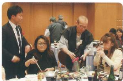
のませ上手!! 石税協No.1ホスト