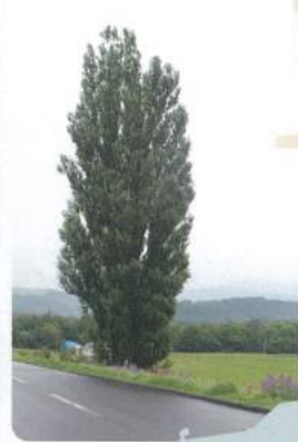
ケンとメリーの木