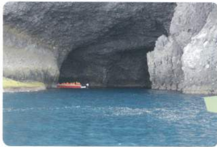
小樽の秘境 青の洞窟