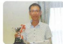
指にとまって良かった (by 長田)