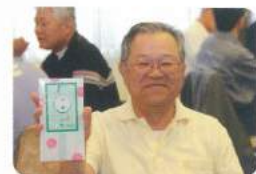
この紋所が、目に入らぬか！