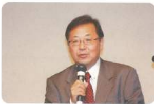
帰りはこわいなあ～