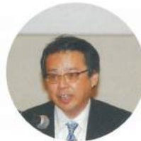
ご質問の件につきましては…