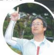
優勝したい人はこの指と～まれ！