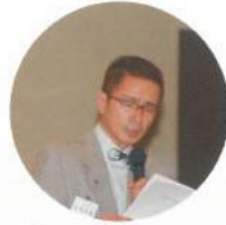
それでは質問します～