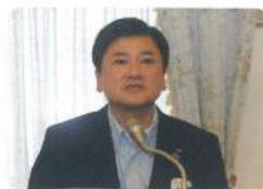
3,000億円達成に向けがんばりましょう