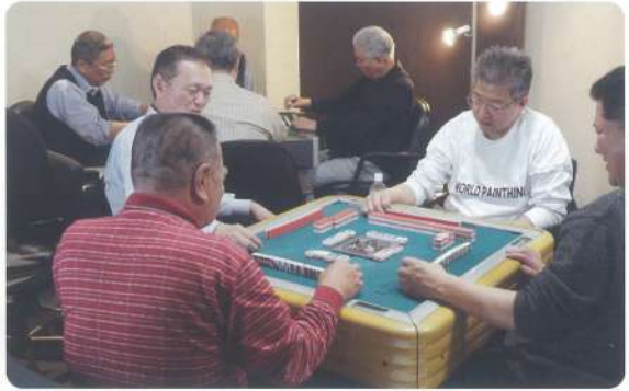
どれをきろうかな?