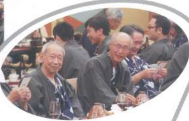
ビンゴ当たらんな～