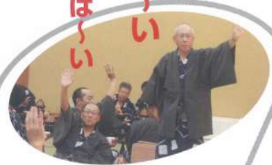
ビンゴ当たってない人～