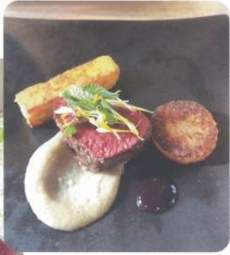
鹿肉おいしかった〜。