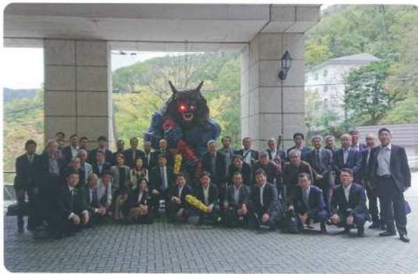
今年は43名の参加でした。

10月10日より公開研究討論会に向けて、北海道へ行ってきました。前日は登別温泉にて鋭気を養い、当日は札幌で熱気のある討論会に参加してきました。帰りは、台風の影響で欠航の可能性もありましたが、無事予定通りに帰り着きました。