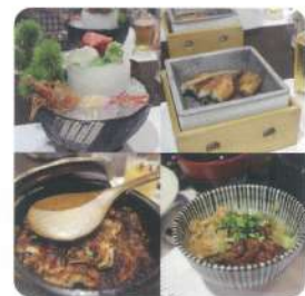
あつた蓬莱軒本店