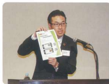
保険をご活用ください!!