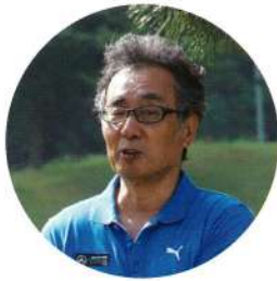
新理事長としての初仕事です

今回のゴルフコンペは、新型コロナウイルス感染症拡大予防対策として表彰式を行わないなど例年とは異なった形式での開催となった。