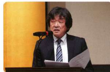
今年もパッパと終わるぜ