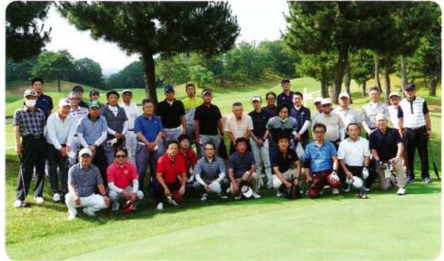
久しぶりのコンペで皆さんやる気マンマンです！